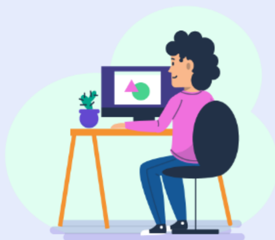
Ścieżka edukacyjno-zawodowa Kasi