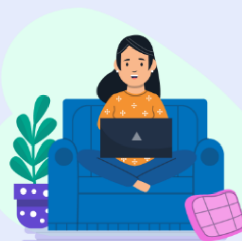
Ścieżka edukacyjno-zawodowa Marty